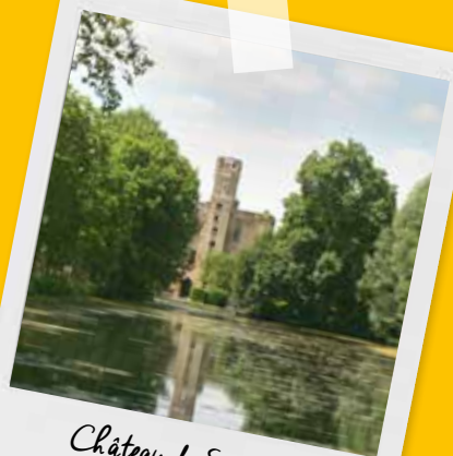
Château de Sagonne

Surplombé par son château, le village témoigne de la période de grande prospérité connue au Moyen Age. Le château, construit entre le XII ème et le XV ème siècle, fut la propriété de Jules Hardouin-Mansart, architecte de Versailles. Aujourd'hui, il conserve une partie de son enceinte fortifiée, un important donjon et une