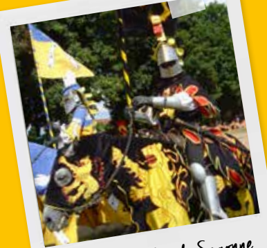
Fêtes médiévales de Sagonne