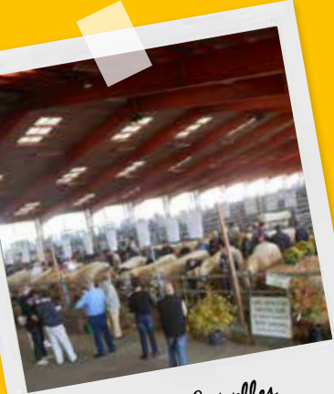
Marché des Grivelles