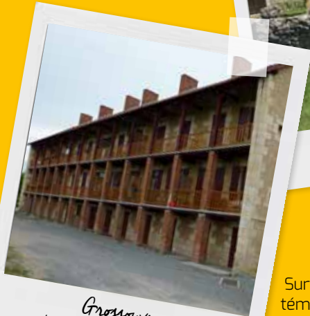
Grossouvre Immeuble Les Galeries

Riche d'un patrimoine industriel unique, la commune de Grossouvre abrite la dernière halle à charbon de bois de type Galloise, récemment réhabilitée en centre d'interprétation pour le grand public sur les grandes étapes de la fabrication du fer, et l'immeuble de logements ouvriers dit Les Galeries, construit en 1833 pour accueillir la main d'œuvre industrielle, tous deux classés monument historique.