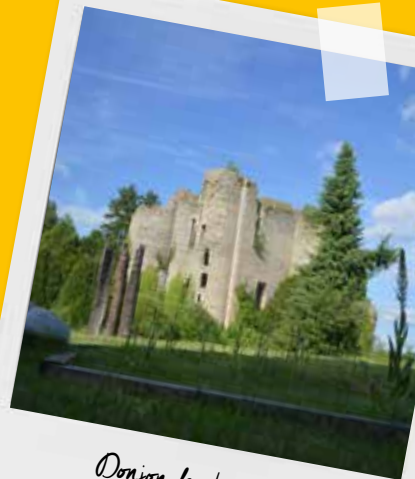
Donjon de Jouy

Dominant la vallée de l'Aubois, le parc du donjon de Jouy est un lieu de rencontre entre l'art et la nature. Lieu d'exposition de sculptures contemporaines, il abrite également une richesse faunistique et floristique exceptionnelle.