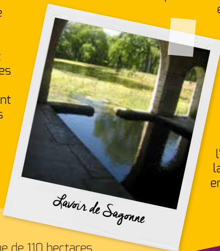
Lavoir de Sagonne

élégante tour d'escalier. Le lavoir, situé à l'entrée du village, a une forme presque carrée, et non rectangulaire comme à l'habitude, et de larges ouvertures en arcades.