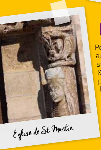
Église de St Martin

élégante tour d'escalier. Le lavoir, situé à l'entrée du village, a une forme presque carrée, et non rectangulaire comme à l'habitude, et de larges ouvertures en arcades.