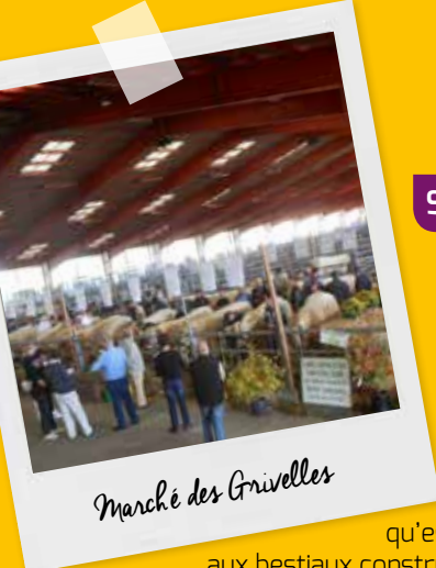
Marché des Grivelles