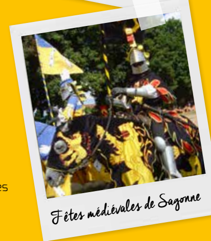
Fêtes médiévales de Sagonne