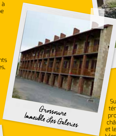
Grossouvre Immeuble Les Galeries

Riche d'un patrimoine industriel unique, la commune de Grossouvre abrite la dernière halle à charbon de bois de type Galloise, récemment réhabilitée en centre d'interprétation pour le grand public sur les grandes étapes de la fabrication du fer, et l'immeuble de logements ouvriers dit Les Galeries, construit en 1833 pour accueillir la main d'œuvre industrielle, tous deux classés monument historique.