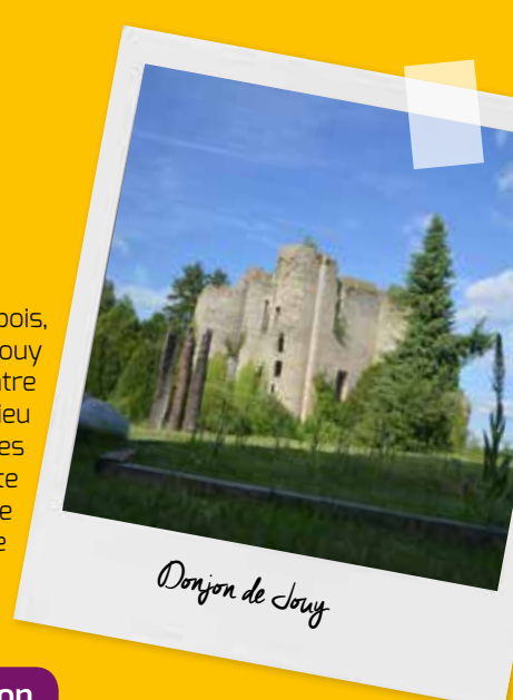
Donjon de Jouy

Dominant la vallée de l'Aubois, le parc du donjon de Jouy est un lieu de rencontre entre l'art et la nature. Lieu d'exposition de sculptures contemporaines, il abrite également une richesse faunistique et floristique exceptionnelle.