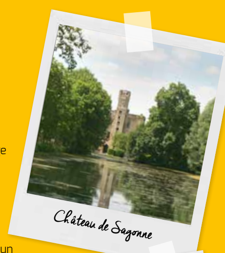
Château de Sagonne

A Lévigny, des murets construits en pierres sèches, c'est-à-dire sans liant mais seulement par des pierres calées entre elles, sont bien visibles. Délimitant les propriétés, ces murets sont typiques dans le sud-ouest du Pays Loire Val d'Aubois.